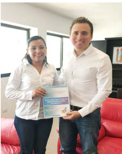
Othón P. Blanco, Quintana Roo a 13 de octubre del 2016.

Este documento responde a las necesidades de dar a conocer brevemente la situación que versa o bien sobre el estado que guardan los derechos humanos en el municipio de Felipe Carrillo Puerto, señalando el total de quejas recibidas, autoridades más señaladas por acciones u omisiones a los derechos humanos, hechos violatorios denunciados con mayor frecuencia, recomendaciones emitidas, entre otros datos; con el interés de redoblar esfuerzos en defensa de los derechos fundamentales