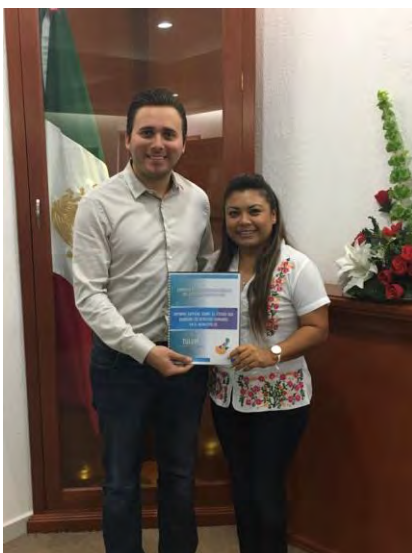
Tulum, Quintana Roo a 07 de noviembre de 2016.

Este documento responde a las necesidades de dar a conocer brevemente la situación que versa o bien sobre el estado que guardan los derechos humanos en el municipio de Tulum, señalando el total de quejas recibidas, autoridades más señaladas por acciones u omisiones a los derechos humanos, hechos violatorios denunciados con mayor frecuencia, recomendaciones emitidas, entre otros datos; con el interés de redoblar esfuerzos en defensa de los derechos fundamentales.