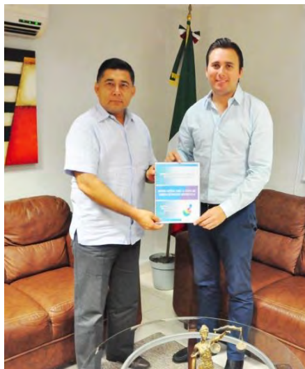
Othón P. Blanco, Quintana Roo a 15 de noviembre del 2016.

Elaborado: Centro de Estudios e Investigación de los Derechos Humanos. Este documento responde a las necesidades de dar a conocer brevemente la situación que versa o bien sobre el estado que guardan los derechos humanos al interior de la Secretaría de Seguridad Pública del Estado de Quintana Roo señalando el total de quejas recibidas, autoridades más señaladas por acciones u omisiones a los derechos humanos, hechos violatorios denunciados con mayor frecuencia, recomendaciones emitidas, entre otros datos; con el interés de redoblar esfuerzos en defensa de los derechos fundamentales.